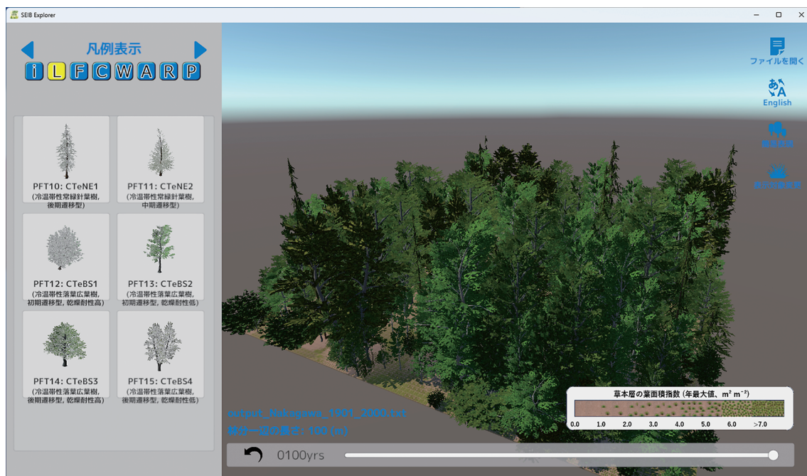
図2. SEIB-Explorerの実行画面(「リアル」表示モード)。図1と異なるのは表示モードのみであり、同一のシミュレーション出力を同じ視点から表示している。

画面左側には情報パネルが設置されており、ボタン操作によって8種類の表示モード(シミュレーション情報、凡例表示、フラックス年集計値、炭素循環、水循環、大気環境、放射収支、植生プロパティ)を切り替えることができる(図3)。「シミュレーション情報」モードでは、表示しているシミュレーションにおける各種実行条件(地点、土壤の物理特性、CO 2 濃度変化、年平均気温および年降水量の変化)が示される。「凡例表示」では、仮想林分に表示される樹種の凡例が表示される。「フラッ